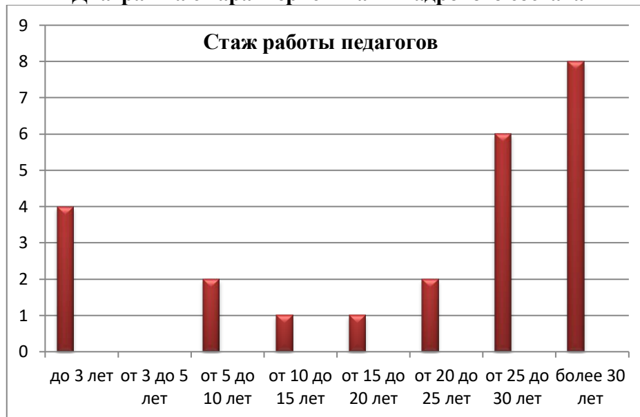
Диаграмма с характеристиками кадрового состава